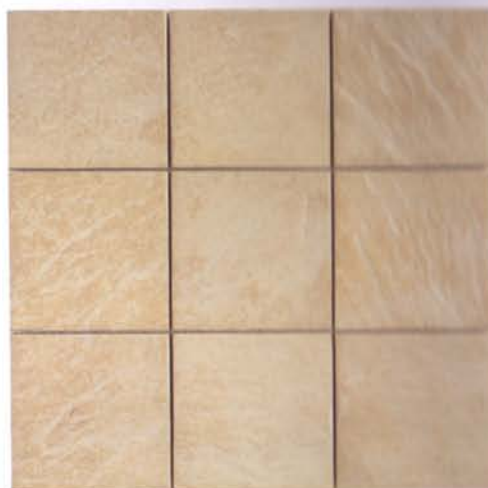
QUARS MOSAIC 10 30,5X30,5cm (enmallado 10X10cm) MC-24 Disponible en todos los colores