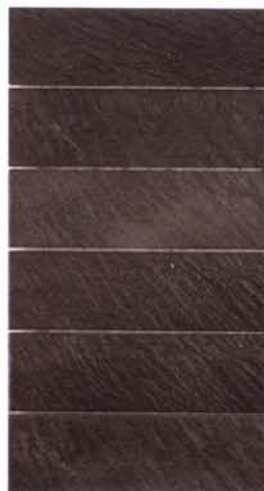
QUARS MURETTO 30,5X20cm (enmallado 5X20cm) MC-18 Disponible en todos los colores