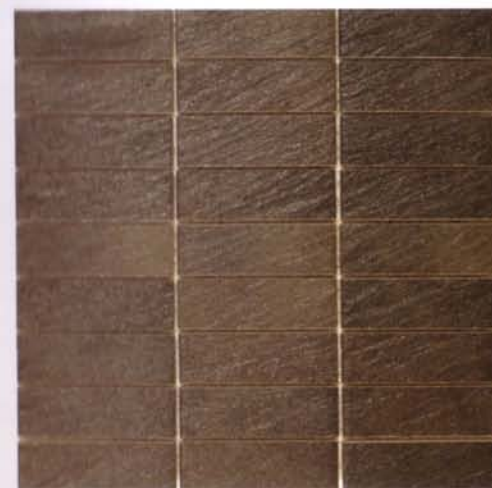
QUARS STICK 30,5X30,5cm (enmallado 3,2X10cm) MC-19 Disponible en todos los colores