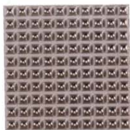
COLMENA PLATA MC-19