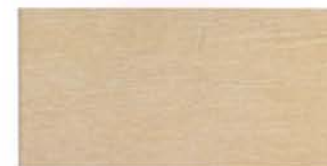
QUARS 10X20 MC-3 Disponible en todos los colores

TODAS LAS PIEZAS ESTAN DISPONIBLES EN LOS CUA- TRO COLORES