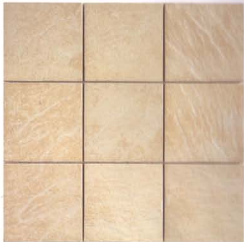
QUARS MOSAIC 10 30,5X30,5cm (enmallado 10X10cm) MC-24 Disponibile en todos los colores