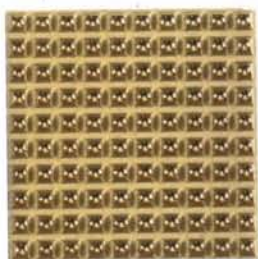
COLMENA ORO MC-19