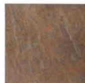
QUARS 10X10 MC-3 Disponible en todos los colores